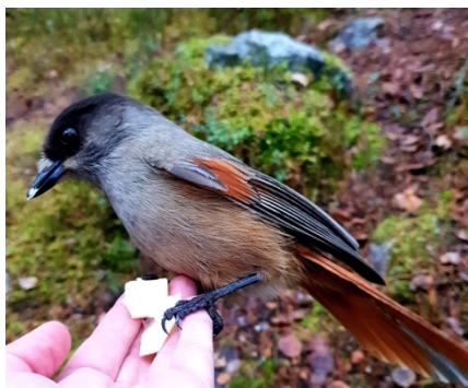
Lavskrika, Talvatis

Kom och var med och tävla om vilket lag, Jokkmokk eller Vuollerim, som ser flest antal olika arter vid samhällets olika fågelmätningar. I år sker tävlingen för 16:e gången. Var med och vinn det vackra vandringspriset med en snidad talgoxe av Kjell Wågberg.