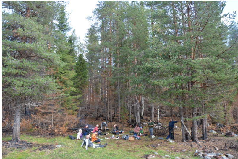
Exkursion till Persbacka den 18 augusti.