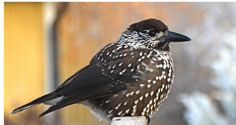
I höst visade sig rekordmånga nötkräkor i Vuollerim.

Facebookgrupp: Fågelskådning i Jokkmokks kommun.