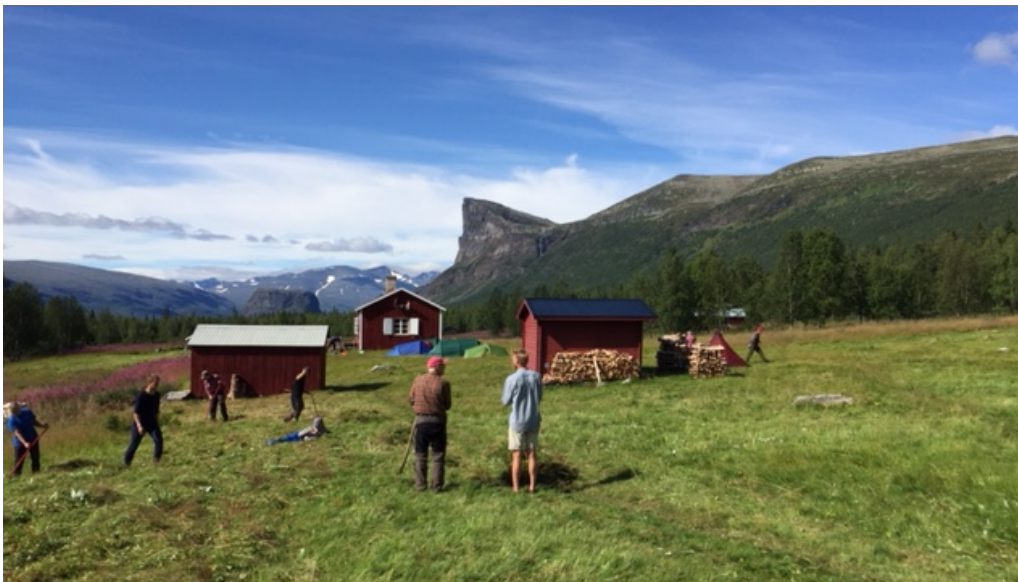
Slåtteri i Aktse med klippan Skierfe i bakgrunden.