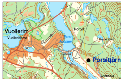
Här ligger Porsitjärn