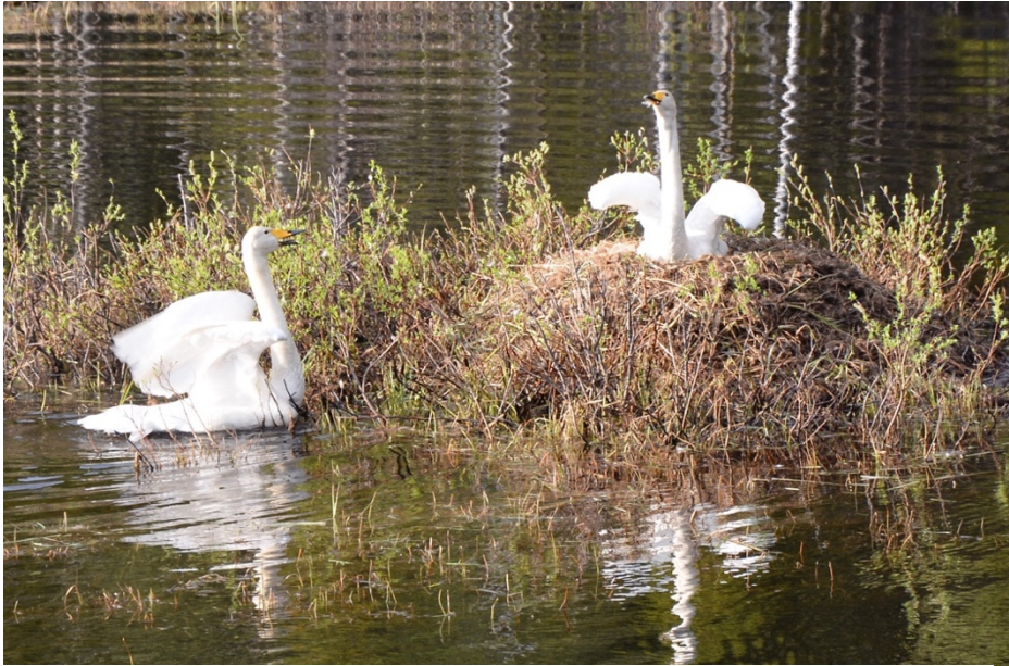
Alldeles nedanför fågeltornet häckar ett sångsvanpar.