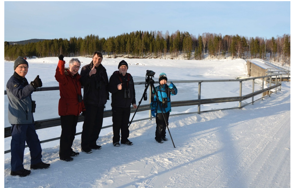
Så här glada blev Vuollerimskådarna förra året när de upptäckte skärpiplärka. Vad tror du vi kan upptäcka i år?