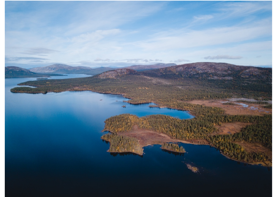
Karatj Råvvåive är ett stort oskyddat gammelskogsområde, väster om Pärälvsreservatet, norr om Karatssjön.