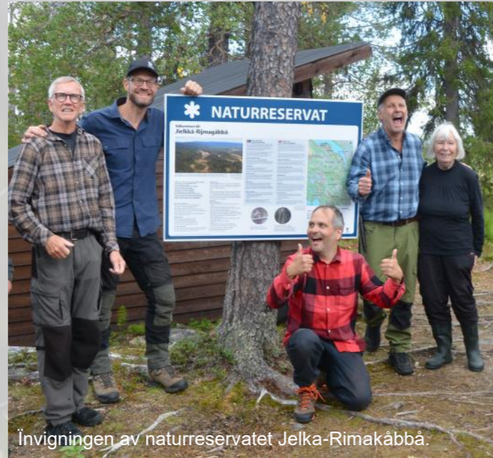
Invigningen av naturreservatet Jelka-Rimakåbbå.

Förhoppningsvis kan vi samlas där till hösten för att gå i mål med de resterande skogarna på Sveaskog.